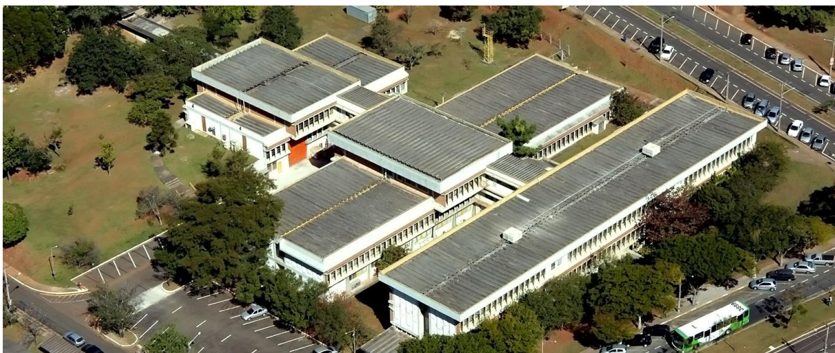
Vista aérea do prédio principal da FEEC.